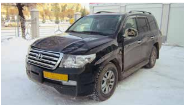
Автомобиль пострадал в ДТП в декабре 2012 года. Страховая компания «НСК» по договору КАСКО выплатила 1 525 108 тенге.