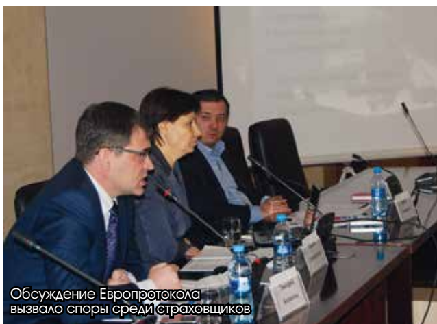
Обсуждение Европротокола вызвало споры среди страховщиков