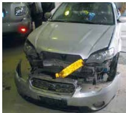
Автомобиль пострадал в ДТП в декабре 2012 года. Страховая компания «НСК» по договору КАСКО оплатила стоимость ремонта в размере 1 069 000 тенге.