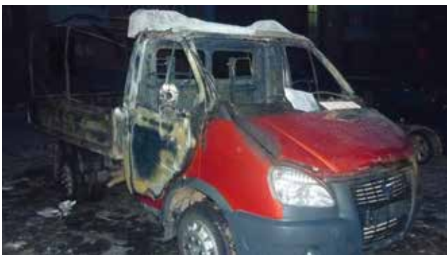
Автомобиль полностью сгорел в результате поджога в ноябре 2012 года. Страховая компания «НСК» по договору КАСКО выплатила 2 213 431 тенге.

Более 217 млн. тенге было выплачено по КАСКО клиентам АО «НСК» в 2012 году.