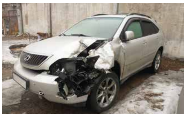
Автомобиль пострадал в ДТП в январе 2013 года. Страховая компания «НСК» по договору КАСКО оплатила ремонт в размере 1 609 000 тенге.