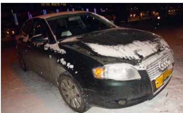
Автомобиль пострадал в ДТП в декабре 2012 года. Страховая компания «НСК» по договору КАСКО оплатила ремонт на фирменном СТО в размере 1 027 508 тенге.