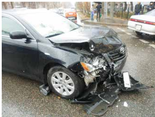
Автомобиль пострадал в ДТП в ноябре 2012 года. Страховая компания «НСК» по договору КАСКО выплатила 1 495 476 тенге.